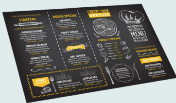
Sets de table